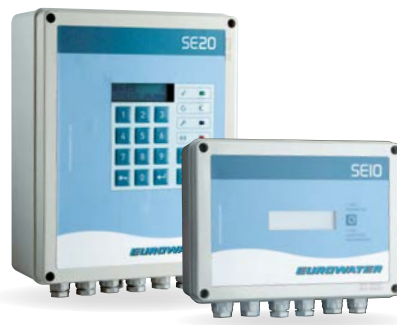
SE10 und SE20 Steuerungen.

Eine einfache Benutzerschnittstelle ermöglicht einen schnellen Zugriff auf